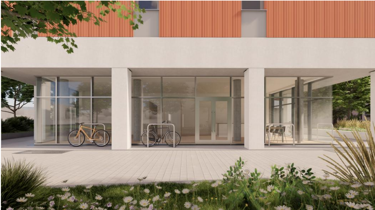
Quelle: Rendering Foodhub Straßenansicht ©Kronaus Mitterer Architekten