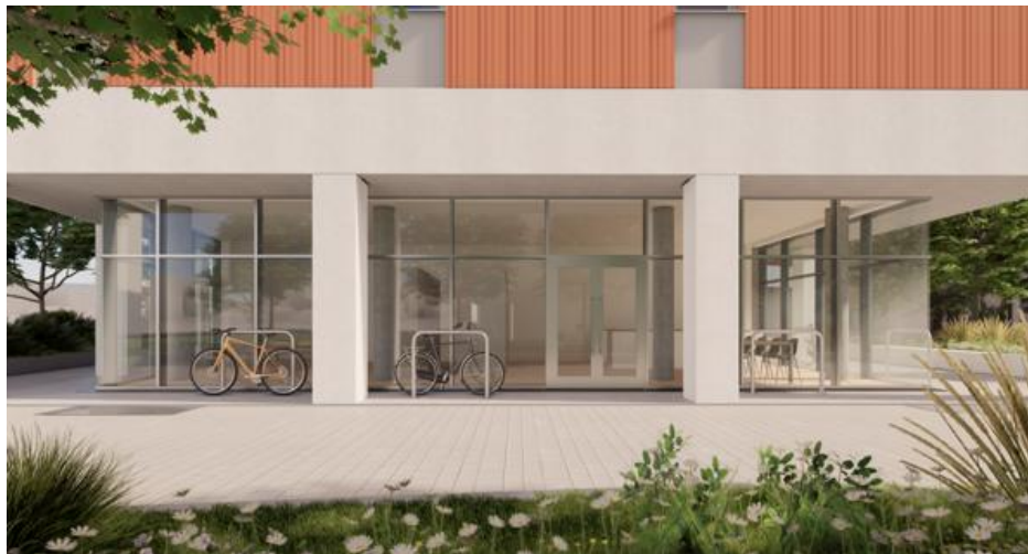
Quelle: Rendering Foodhub Straßenansicht ©Kronaus Mitterer Architekten

GST 2044/35, EZ 3851, KG 01101 Favoriten